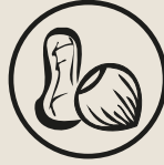
FRUTOS SECOS Y CACAHUETE